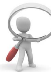
SPRAWDZENIA DLA GIODO