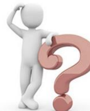
PYTANIA I ODPOWIEDZI