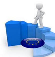
INSPEKTOR OCHRONY DANYCH

(C) GIODO 2016 Wszelkie prawa zastrzeżone.